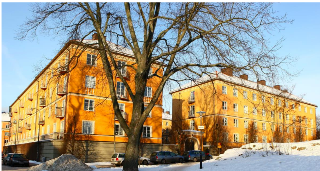
Figur 6 Storgårdskvarteret Meterns portal kommer gömmas bakom det nybyggda huset