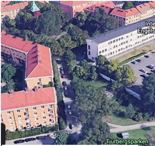
Figur 1 Planområdet

Stockholm stad vill tillåta att ett 7-våningshus byggs i Helgalunden på Södermalm. Förslaget är ute på samråd och allmänheten kan nu lämna synpunkter fram till 26 oktober.