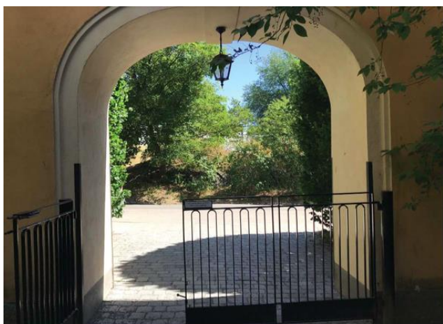
Portiker mot Helgagatan, före

Entrén till det nya huset kommer att ligga mittemot kvarteret Meterns portal. Eftersom Helgagatan är smal och enkelriktad kommer det att bli trångt när boende i de båda husen samt varutransporter till förskola och restaurang ska röra sig samtidigt, trots planerad lastzon framför portalen. Detta enligt projektets egen barnkonsekvensanalys.