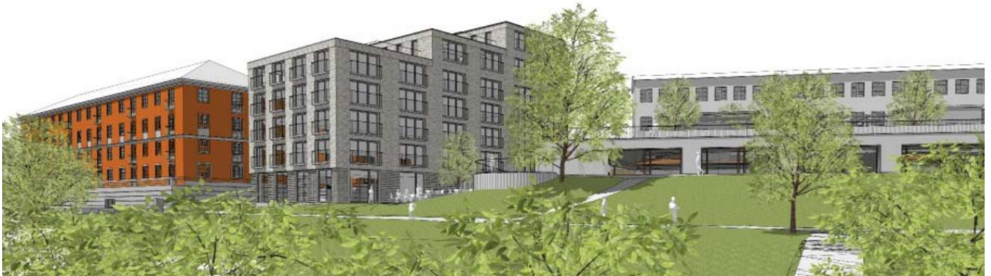
Figur 2 Vy från Tjurbergsparken

Det föreslagna huset planeras rymma 65 lägenheter och bli 5-7 våningar högt. I bottenvåningen föreslås en restaurang med glasparti och entré mot Helgagatan och uteservering mot Tjurbergsparken. Tillsammans med tillhörande bebyggelse i form av trappor med mera, kommer byggnaden ta upp hela det grönområde som idag binder ihop Helgalunden med Tjurbergsparken.