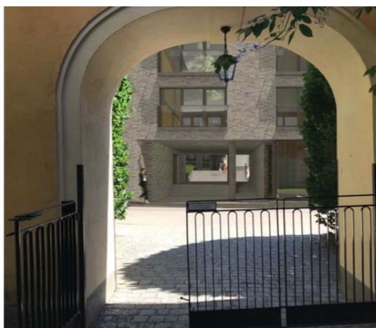
Portiker mot Helgagatan, efter