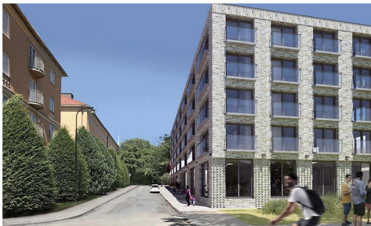
Figur 3 Helgagatan efter att huset byggts

Huset planeras ligga längs Helgagatan med en trottoar framför huset. Dagens berg har sprängts bort och flera stora träd, bland annat en eller två stora almar, har ersatts av ett hus som är helt utan förgård. Visionsbilden nedan är en sommarbild tagen mitt på dagen, så det framgår inte hur det nya huset kommer skugga 1920-talsbyggnaden på andra sidan gatan.